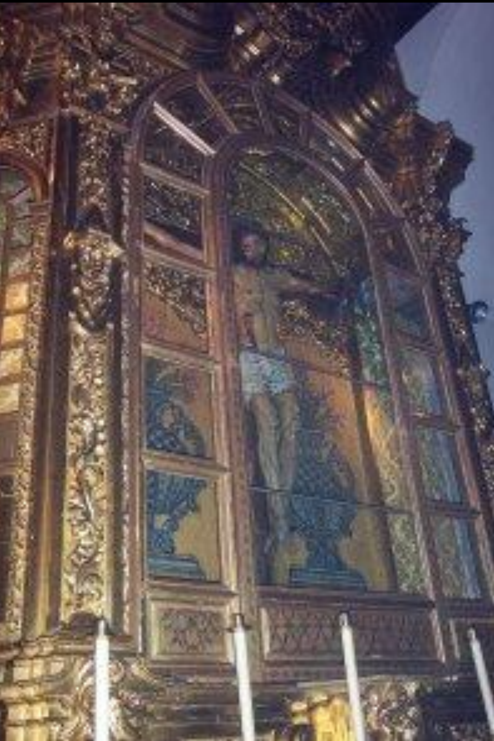
Crucificado obra de Jacobo Florentino.