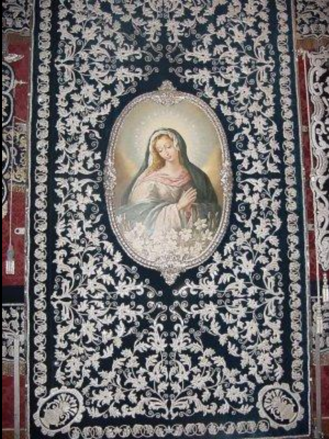
Palio. Inmaculada rodeada de azucenas, obra de López Vázquez.