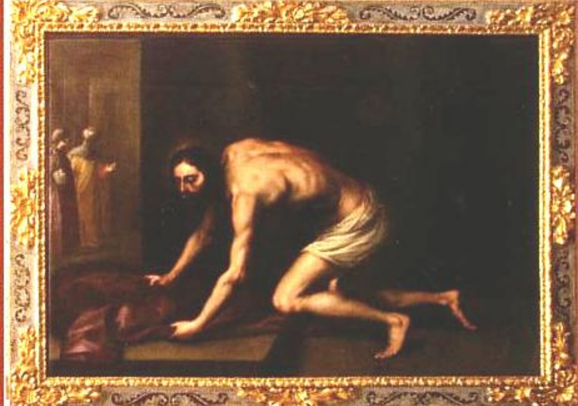
Cristo recogiendo las vestiduras P.A.Bocanegra