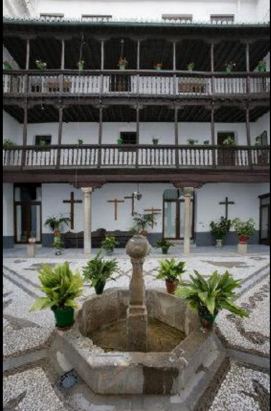
Patio claustral morisco