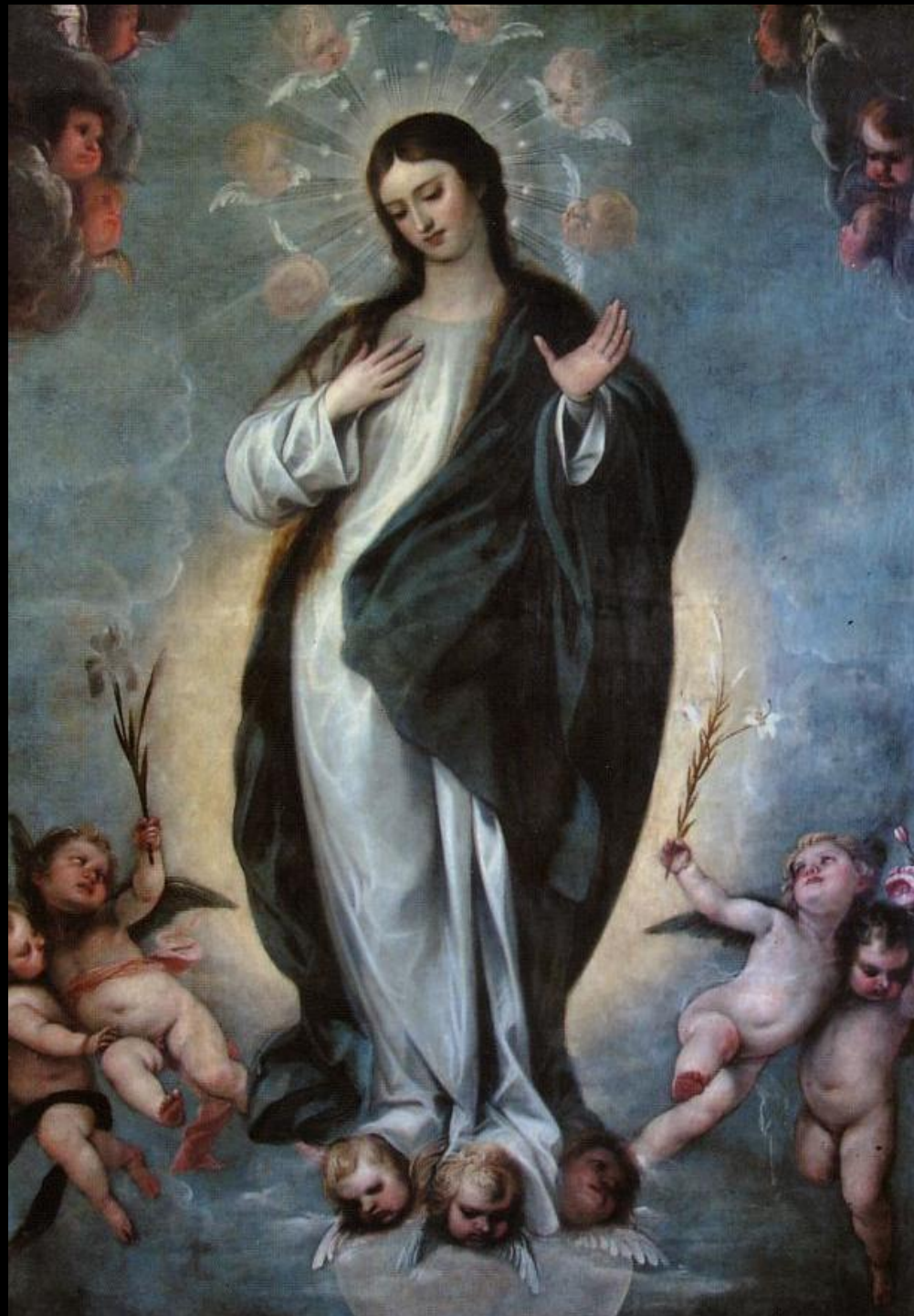
Inmaculada Concepción. Óleo sobre lienzo. Circulo de Alonso Cano.