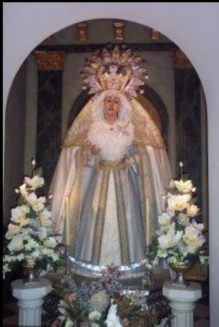
VIRGEN DE LA CONCEPCIÓN "LA CONCHA"