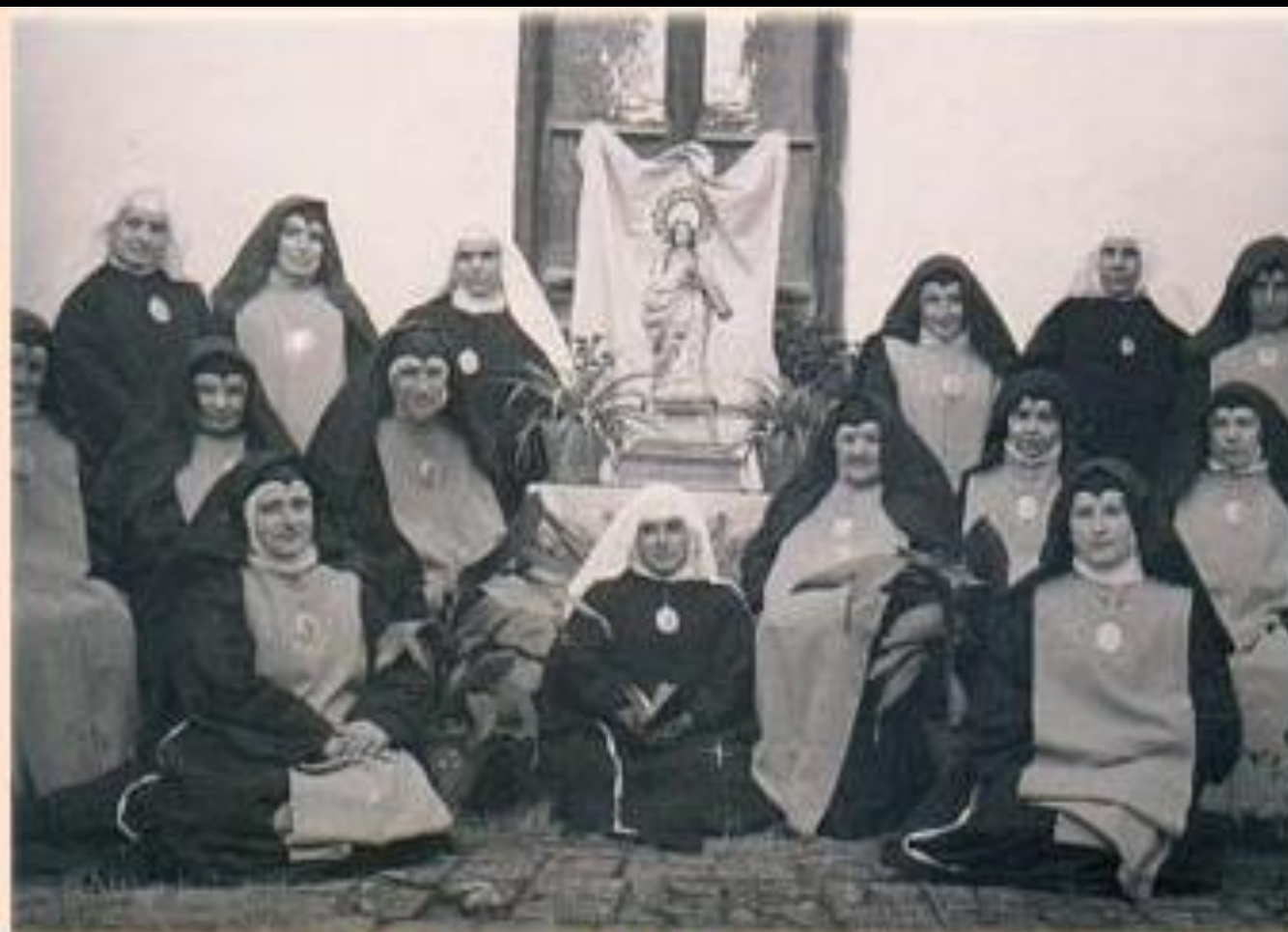
Comunidad hacia 1935 aproximadamente