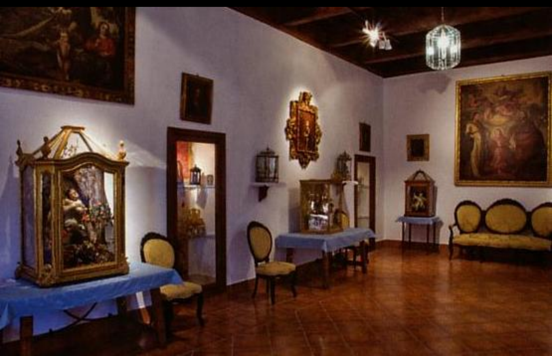
Sala de Comunidad